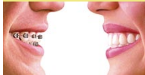
Statt einer unansehnlichen Klammer die fast unsichtbare Invisalign-Lösung – für optimale, gerade Zähne.

Neben der Implantologie, die zum Zuge kommt, wenn keine anderen Maßnahmen einen erkrankten Zahn heilen können, bietet die Praxis auch präventiv und konservativ ein breites Behandlungsspektrum. Ob unsichtbare Zahnklammern, mit denen sogar im Erwachsenenalter Fehlstellungen korrigiert werden können, oder auch Ozonbehandlungen bei oberflächlichen Destruktionen, das revolutionäre Cerec-System, das sofort individuelle Füllungen bereitstellt, die in den Zahn dauerhaft eingesetzt werden oder professionelles, ärztlich betreutes Bleaching mit dem Zoom-System: Die Praxis hält ein sinnvoll aufgebautes Behandlungsrepertoire bereit, das je nach Erfordernis seinen Teil dazu beiträgt, dass der Patient mit seinem schönsten Lächeln die Praxis verlässt. Noch ein kurzer Satz: Auch das Prophylaxe-Konzept, das so frühzeitig Probleme erkennt, dass es erst gar nicht zu größeren Eingriffen kommen muss, ist ausgereift und überaus modern ausgerichtet. Und die Freundlichkeit des Teams tut ein Übriges dazu – mitten im Herzen der Bergstadt Lüdenscheid.